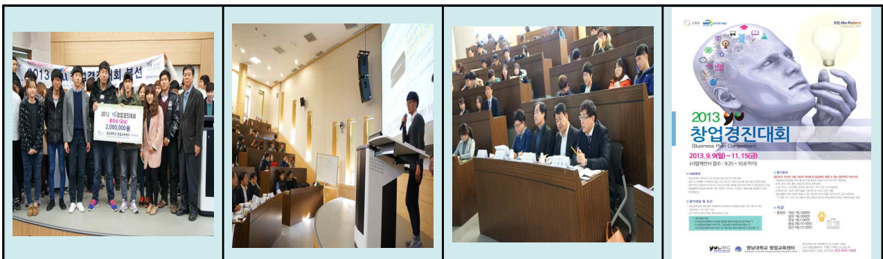
[2013년 YU 창업경진대회 모습]